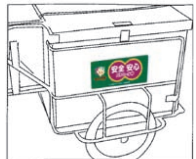
台車用 啓発ステッカー