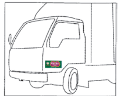
トラック用 啓発マグネット