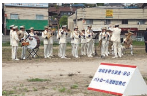
広島県警察音楽隊の演奏