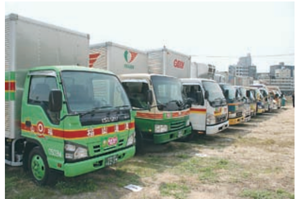
安全・安心出発パレード参加車両

「毎月21日を防犯情報発信の日」として荷物の宅配先に広島県警察からの防犯情報に関する広報紙を毎月、お荷物とともに直接手渡しする事により、安全・安心の呼びかけ活動。