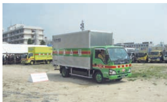
安全・安心出発パレード