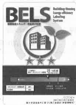
〔図1〕 ガイドラインに基づく第三者認証の例

また、デマンドリスポンスに対応した時間帯別・季節別の電気料金メニューが選択できる場合はその活用にも努めるとともに、エネルギー管理システム（BEMS・HEMS等）の導入により、ビルの運用方法、住宅の住まい方の改善によるピーク対策及び省エネルギーに努めること。