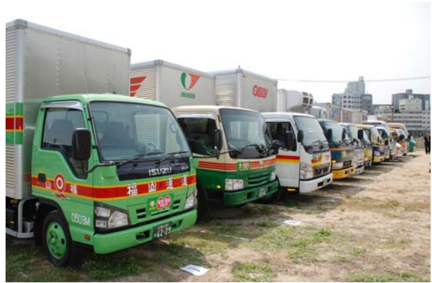
【安全・安心出発パレード参加車両】

「毎月21日を防犯情報発信の日」として荷物の宅配先に広島県警察からの防犯情報に関する広報紙を毎月、お荷物とともに直接手渡する事により、安全・安心の呼びかけ活動。