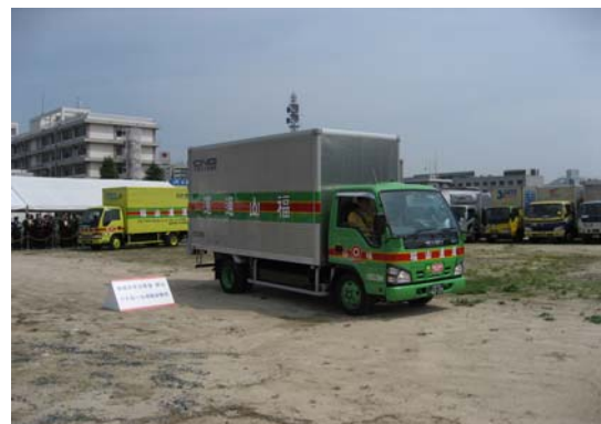
【安全・安心出発パレード】