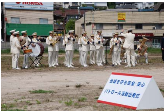
【広島県警察音楽隊の演奏】