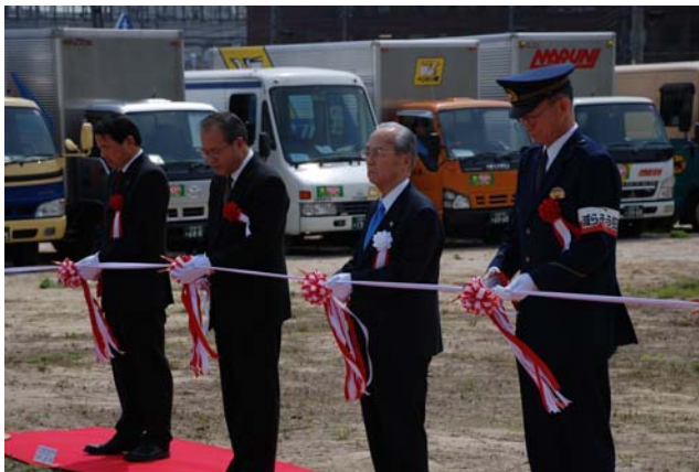
【テープカット風景】

式典には、各報道機関（広島テレビ、ホームテレビ、TSS、中国新聞、業界紙）が取材を行い、式典等の様子が夕方のニュースや翌日の朝刊（中国新聞）に大きく取り上げられました。